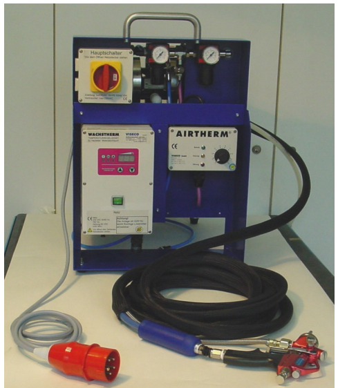
Das Heißspritzsystem: Der Airtherm zusammen mit beheiztem Materialschlauch und Doppelmembranpumpe.